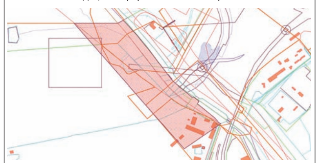
Площадь элемента планировочной структуры: 138283,06 м2.