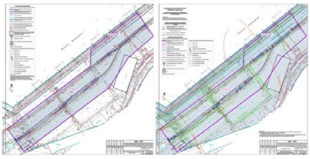
Чертеж планировки и межевания территории Чертеж красной линии. Разбивочный чертеж

Администрация Находкинского городского округа Приморского края