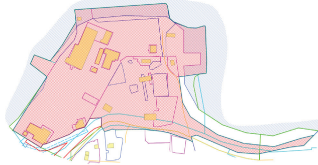
Схема границ территории для подготовки документации по планировке территории, ограниченной улицей Нижне-Набережной, границами территориальной зоны автомобильного транспорта в городе Находке, микрорайоне «поселок Врангель»

Площадь территории в границах документации по планировке территории: 62169,23 кв. м