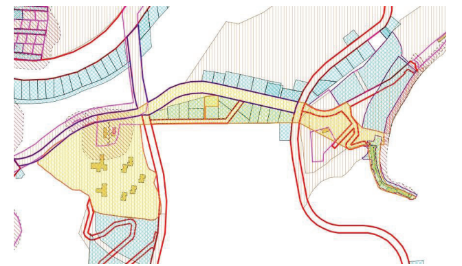
Граница территории ДПТ, утвержденной постановлением от 07.07.2016 № 752