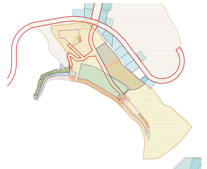
Граница территории ДПТ, утвержденной постановлением от 12.10.2012 № 1734